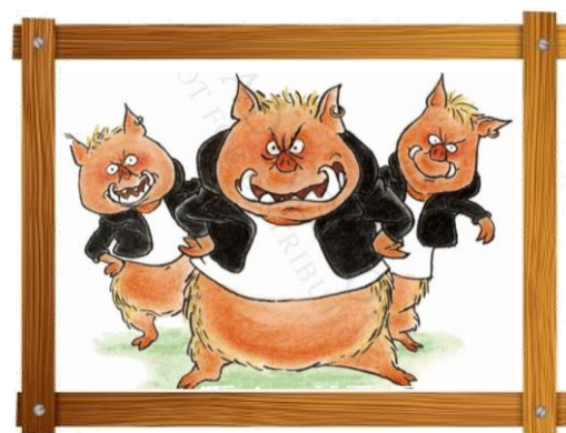
Keld-Orne og svinebæsterne