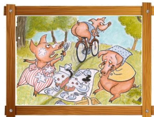
Hr. og fru Basse